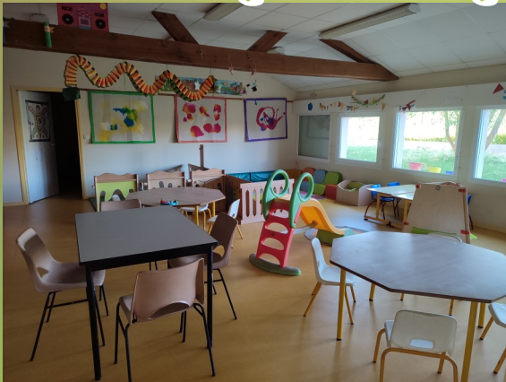
Salle des 3-6 ans