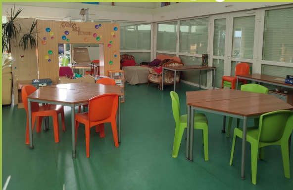
coin acti des grands