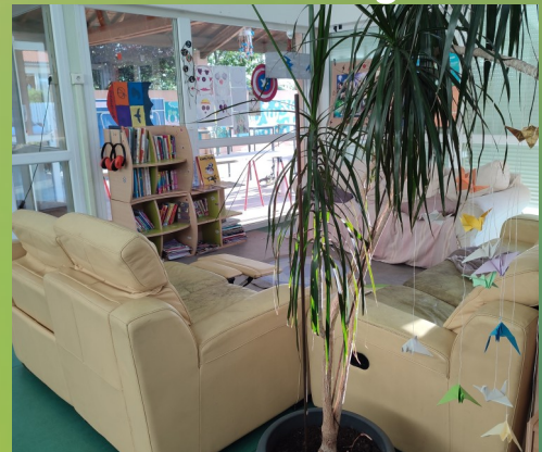
coin lecture grands